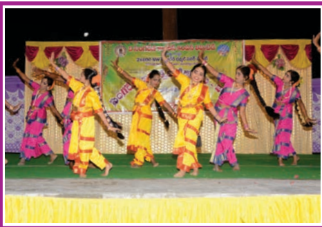
సింగరేణి థర్మల్ విద్యుత్ కేంద్రంలో