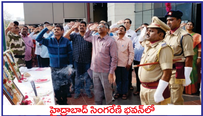
హైద్రాబాద్ సింగరేణి భవన్ లో