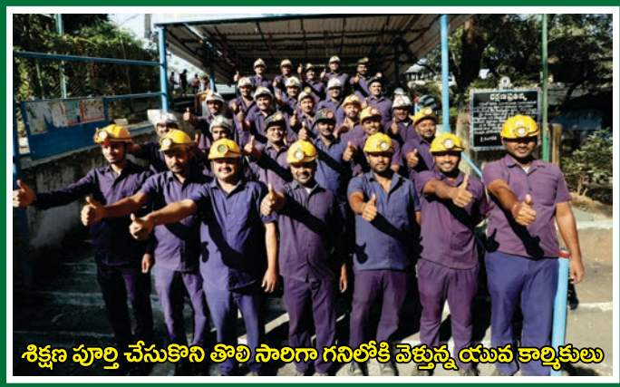
శిక్షణ పూర్తి చేసుకొని తొలి సారిగా గనిలోకి వెళ్తున్న యువ కార్మికులు