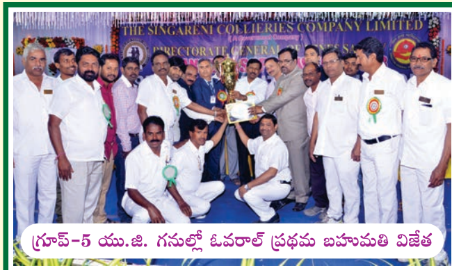
గ్రూప్-5 యు.జి. గనుల్లో ఓవరాల్ ప్రథమ బహుమతి విజేత

కె.కె.-5 (మందమర్రి)కి బహుమతి అందజేస్తున్న సంస్థ డైరెక్టర్లు