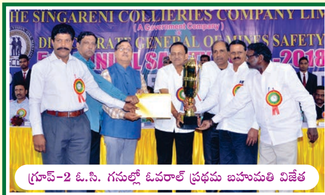
గ్రూప్-2 ఓ.సి. గనుల్లో ఓవరాల్ ప్రథమ బహుమతి విజేత