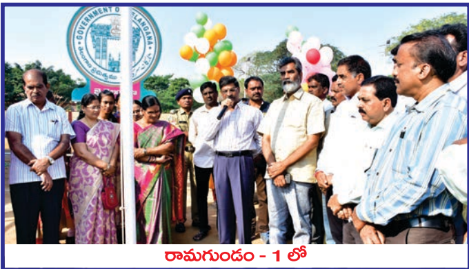
రామగుండం - 1 లో