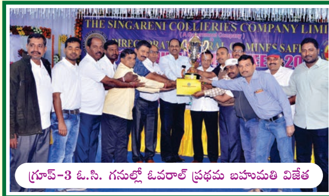
గ్రూప్-3 ఓ.సి. గనుల్లో ఓవరాల్ ప్రథమ బహుమతి విజేత

ఆర్.కె.-5 (శ్రీరాంపూర్)కి బహుమతి అందజేస్తున్న సంస్థ డైరెక్టర్లు