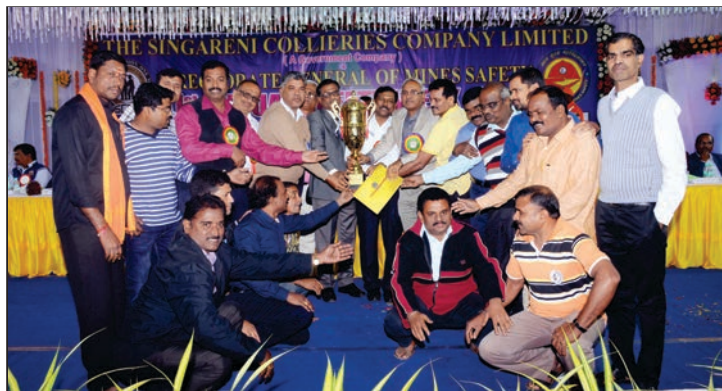
శ్రీరాంపూర్లో డిసెంబర్ 19వ తేదీన జరిగిన 51వ వార్షిక రక్షణ వారోత్సవాల బహుమతి ప్రధానోత్సవ వేడుకలో ఉత్తమ గనులకు బహుమతులు అందజేస్తున్న సంస్థ డైరెక్టర్లు, డి.జి.ఎం.ఎస్. అధికారులు.