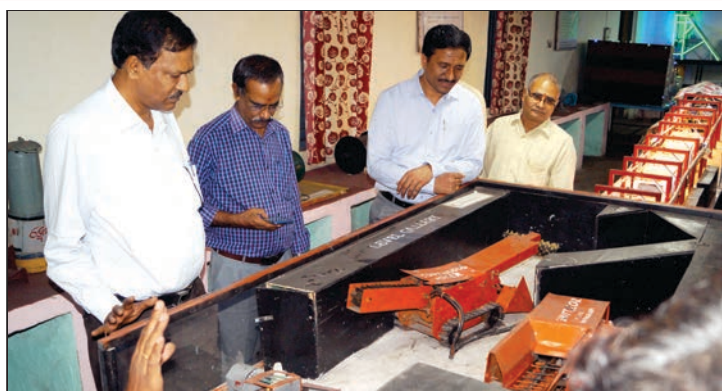
కొత్తగూడెం ఎం.వి.టి.సి.లో చర్చింగ్ మోడల్స్ తో ఉద్యోగులకు ఇస్తున్న శిక్షణను పరిశీలించిన డైరెక్టర్ పైనాస్ శ్రీ ఎస్.బలరాం ఐ.ఆర్.ఎస్.