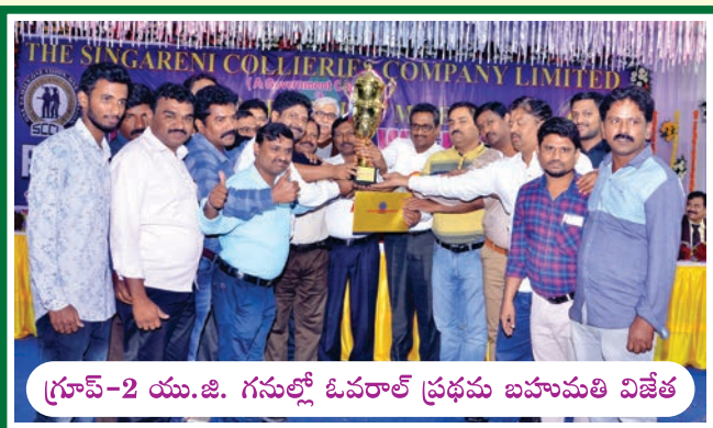
గ్రూప్-2 యు.జి. గనుల్లో ఓవరాల్ ప్రథమ బహుమతి విజేత