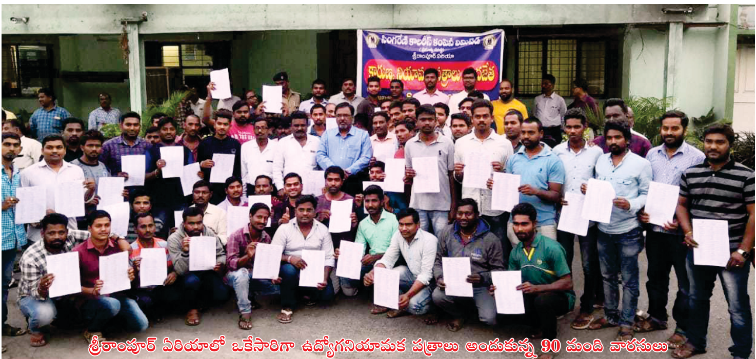
శ్రీరాంపూర్ ఏరియాలో ఒకేసారిగా ఉద్యోగనియామక పత్రాలు అందుకున్న 90 మంది వారసులు

పాల్గొన్నారు. సింగరేణి వ్యాప్తంగా అన్ని ఏరియాలలో మెడికల్ అన్ ఫిట్ అయిన కార్మికుల స్థానంలో వారు తాము సూచించిన వారసులకు యాజమాన్యం ఉద్యోగ నియామక పత్రాలు అందిస్తోంది. కాగా కొంతమంది అన్ ఫిట్ కార్మికులు వారసులను నిర్ణయించడంలో జాప్యం చేస్తున్నారని తెలుస్తోంది. దీనిపై సంబంధిత అధికారులు అన్ ఫిట్ కార్మికులకు కౌన్సిలింగ్ నిర్వహిస్తూ సత్వరమే వారసుల పేరుతో ఉద్యోగానికి ధరఖాస్తులు చేసుకోవాల్సిందిగా సూచిస్తున్నారు. కొత్తగా నియుక్తులైన వారసులు సింగరేణిలో ఉద్యోగం దొరకడం అదృష్టంగా భావిస్తున్నామని, బాగా పనిచేసి కంపెనీకి, కుటుంబానికి మంచిపేరు తెస్తామని అంటున్నారు. శిక్షణ కాలంలో అధికారులు, సీనియర్ కార్మికులు ఎంతో ఆదరణతో చూస్తున్నారని వారు ఆనందం వ్యక్తం చేస్తున్నారు.