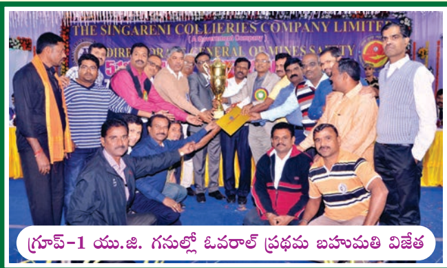
గ్రూప్-1 యు.జి. గనుల్లో ఓవరాల్ ప్రథమ బహుమతి విజేత