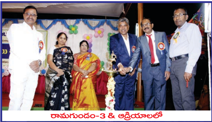
రామగుండం-3 & ఆర్డియాలలో