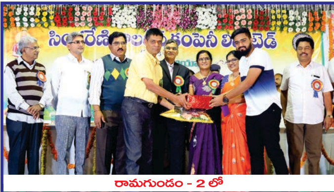
రామగుండం - 2 లో