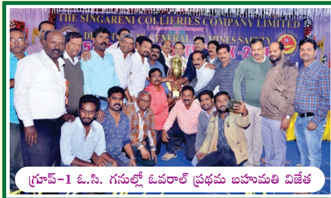
గ్రూప్-1 ఓ.సి. గనుల్లో ఓవరాల్ ప్రథమ బహుమతి విజేత

ఆడియాల ప్రాజెక్ట్ కి బహుమతి అందజేస్తున్న సంస్థ డైరెక్టర్లు