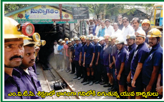
ఎం.వి.టి.సి. శిక్షణలో భాగంగా గనిలోకి దిగుతున్న యువ కార్మికులు