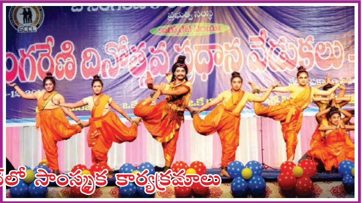
కార్పొరేట్ సెంట్రల్ ఫంక్షన్లో సాంస్కృతిక కార్యక్రమాలు