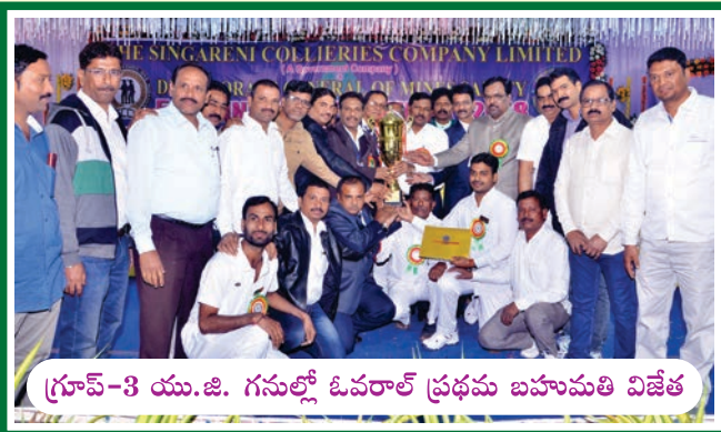
గ్రూప్-3 యు.జి. గనుల్లో ఓవరాల్ ప్రథమ బహుమతి విజేత

జె.వి.ఆర్. ఓ.సి. (కొత్తగూడెం)కి బహుమతి అందజేస్తున్న డిప్యూ.డిజియంఎస్ శ్రీ విద్యాపతి