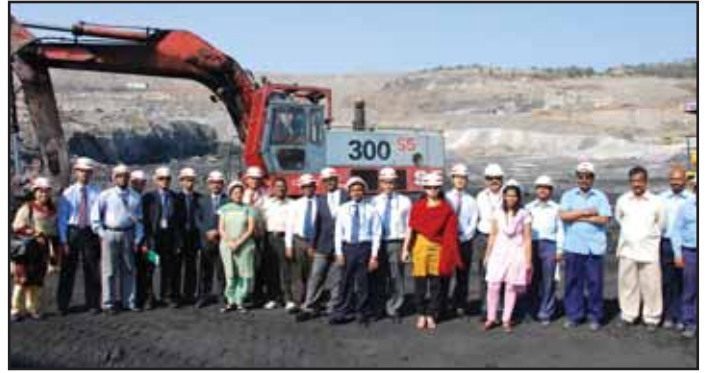
తమ శిక్షణలో భాగంగా కొత్తగూడెం ఏరియాలో డిసెంబర్ 26న జి.కె. ఓ.సి. గనిని సందర్శించిన ఐ.ఎ.ఎస్. ట్రైనీలు.