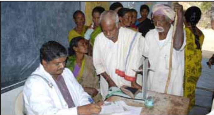
ఇల్లందు ఏరియా పరిధిలో ఏరాయిగూడెం గ్రామంలో మార్చి 24న కంపెనీ నిర్వహించిన ఉచిత వైద్యశిబిరంలో వైద్యసేవలు పొందుతున్న గ్రామస్థులు.