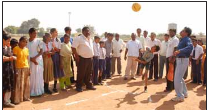
రామగుండం-2 ఏరియాలో అంతర్జాతీయ వికలాంగుల దినోత్సవం నాడు వికలాంగులకు క్రీడా పోటీలు నిర్వహిస్తున్న దృశ్యం.