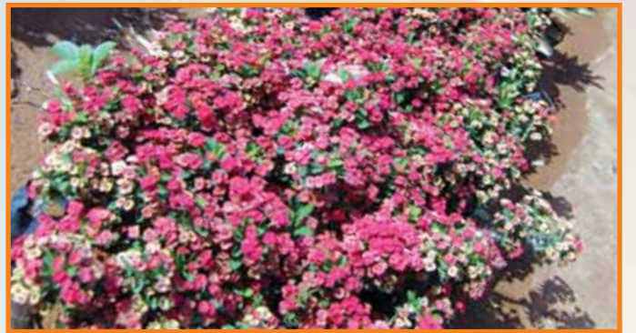
యూఫోర్బియా మిలీ (హైబ్రీడ్) మొక్కలు