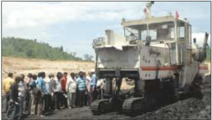
ఇల్లందు కోయగూడెం ఓ.సి.లో సర్వేస్ మైనర్ ను పరిశీలిస్తున్న విలేఖరులు దృశ్యం