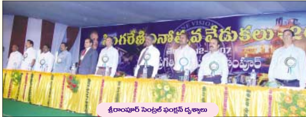
శ్రీరాంపూర్ సెంట్రల్ ఫంక్షన్ దృశ్యాలు