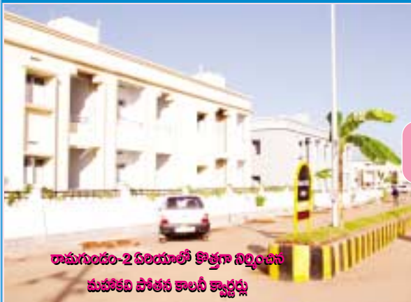
రామగుండం-2 ఏరియాలో కొత్తగా నిర్మించిన మహాకవి పోతన కాలనీ క్వార్టర్లు

మన సంస్థ కార్మిక గృహవసతి కల్పనలో ఎంతో ముందుంది. ఇటీవల కాలంలో అనేక చోట్ల కొత్త తరహాలో విశాలమైన ఆధునిక