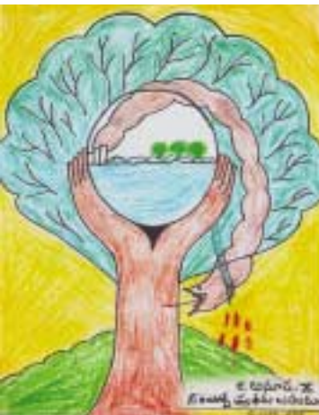
సింగరేణి విద్యార్థులకు నిర్వహించిన స్కాట్లీ ప్రియంటింగ్లో ప్రథమ బహుమతి పొందిన చిత్రం