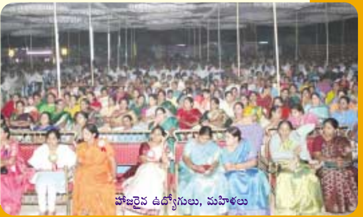
హాజరైన ఉద్యోగులు, మహిళలు

ఇతర బహుమతులు పవర్ హౌస్ విభాగంలో కొత్తగూడెం పవర్ హౌస్, 132 కె.వి.స్టేషన్ విభాగంలో మందమర్రి 132 కె.వి. స్టేషన్, ఎం.వి.టి.సి. విభాగంలో ఎం.వి.టి.సి శ్రీరాంపూర్, రెవెన్యూ స్టేషన్లో ఆర్.ఆర్.ఆర్.టి. మందమర్రి స్టేషన్ ఉత్తమ బహుమతులు సాధించాయి. ఇవేకాక భూగర్భ, ఓ.సి గనుల్లో వివిధ విభాగాల్లో ప్రథమ, ద్వితీయ బహుమతులు ఇవ్వబడ్డాయి.