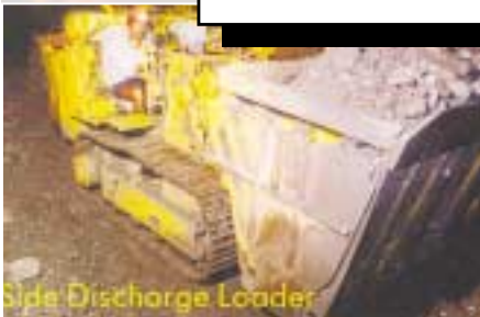
Side Discharge Loader