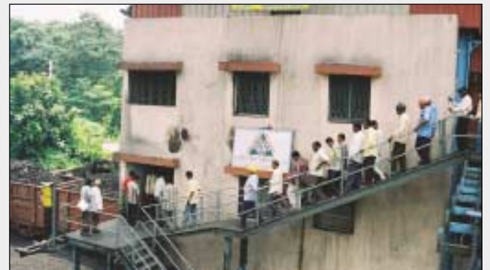
మణుగూరులో బొగ్గు రాపిడ్ లోడింగ్ సిస్టమ్ ను పరిశీలిస్తున్న విలేకర్లు